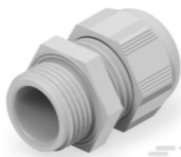
TE Teilnr.: 1SNG601049R0000 EP-SG-M20-LGR-A