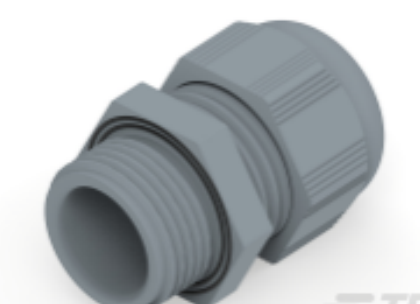
TE Teilnr.: 1SNG601056R0000 EP-SG-M20-GR-C