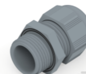
TE Teilnr.: 1SNG601056R0000 EP-SG-M20-GR-C