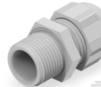
TE Teilnr.: 1SNG601052R0000 EP-SG-M20-LGR-B