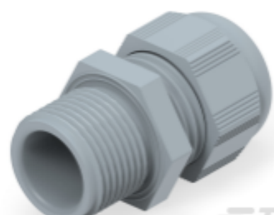
TE Teilnr.: 1SNG601053R0000 EP-SG-M20-GR-B