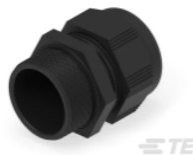
TE Teilnr.: 1SNG601123R0000 EP-SG-M40-BL-B