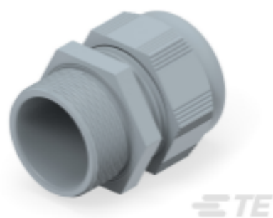
TE Teilnr.: 1SNG601122R0000 EP-SG-M40-GR-B