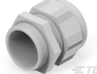
TE Teilnr.: 1SNG601124R0000 EP-SG-M40-LGR-C