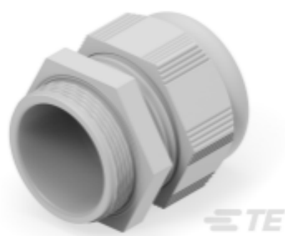
TE Teilnr.: 1SNG601118R0000 EP-SG-M40-LGR-A