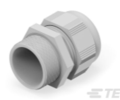
TE Teilnr.: 1SNG601121R0000 EP-SG-M40-LGR-B