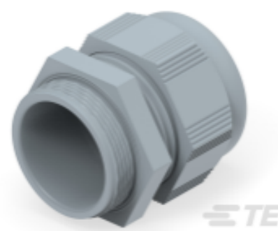
TE Teilnr.: 1SNG601119R0000 EP-SG-M40-GR-A