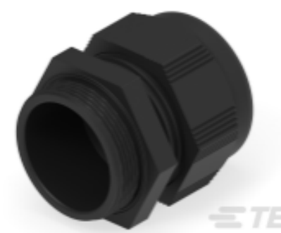
TE Teilnr.: 1SNG601120R0000 EP-SG-M40-BL-A