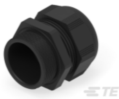
TE Teilnr.: 1SNG601141R0000 EP-SG-M50-BL-B