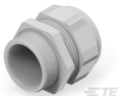
TE Teilnr.: 1SNG601136R0000 EP-SG-M50-LGR-A