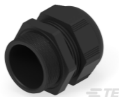
TE Teilnr.: 1SNG601138R0000 EP-SG-M50-BL-A