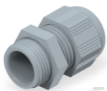
TE Teilnr.: 1SNG601194R0000 EP-SG-PG11-GR-A