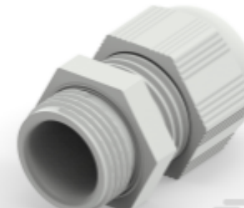
TE Teilnr.: 1SNG601196R0000 EP-SG-PG11-LGR-B