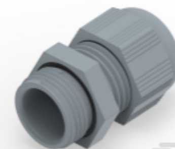
TE Teilnr.: 1SNG601197R0000 EP-SG-PG11-GR-B