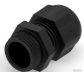
TE Teilnr.: 1SNG601198R0000 EP-SG-PG11-BL-B