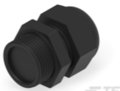
TE Teilnr.: 1SNG601210R0000 EP-SG-PG16-BL-B