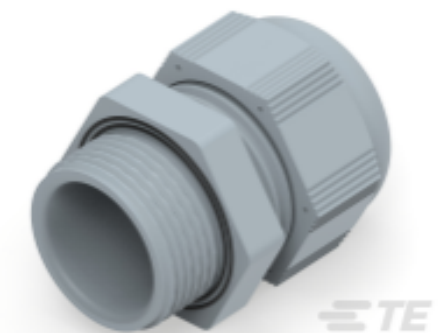
TE Teilnr.: 1SNG601209R0000 EP-SG-PG16-GR-B