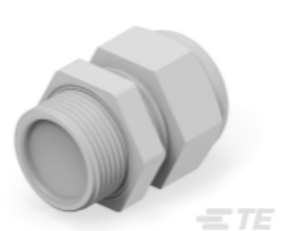
TE Teilnr.: 1SNG601208R0000 EP-SG-PG16-LGR-B