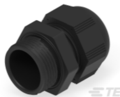
TE Teilnr.: 1SNG601207R0000 EP-SG-PG16-BL-A