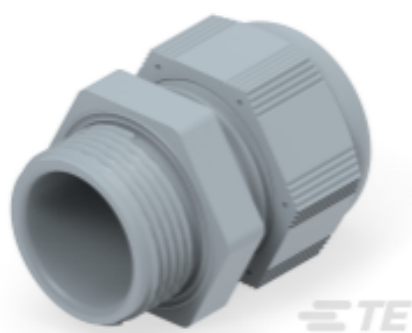
TE Teilnr.: 1SNG601206R0000 EP-SG-PG16-GR-A