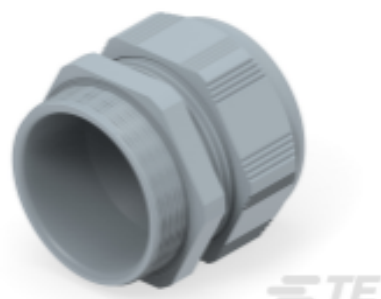
TE Teilnr.: 1SNG601236R0000 EP-SG-PG48-GR-A