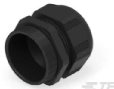
TE Teilnr.: 1SNG601237R0000 EP-SG-PG48-BL-A