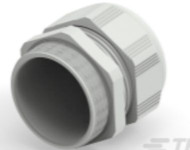
TE Teilnr.: 1SNG601238R0000 EP-SG-PG48-LGR-B