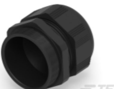
TE Teilnr.: 1SNG601240R0000 EP-SG-PG48-BL-B