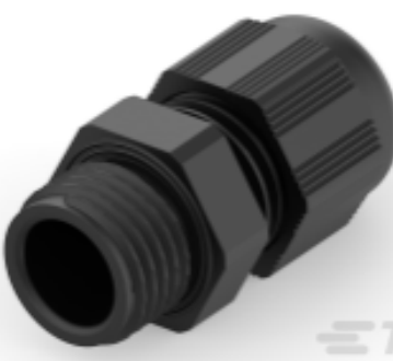
TE Teilnr.: 1SNG601186R0000 EP-SG-PG7-BL-B