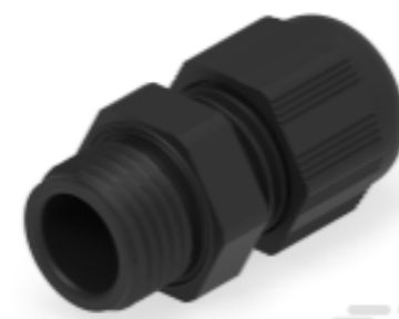
TE Teilnr.: 1SNG601183R0000 EP-SG-PG7-BL-A