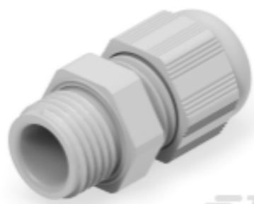
TE Teilnr.: 1SNG601181R0000 EP-SG-PG7-LGR-A