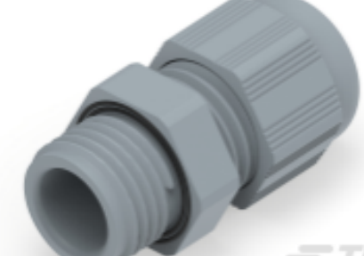
TE Teilnr.: 1SNG601185R0000 EP-SG-PG7-GR-B