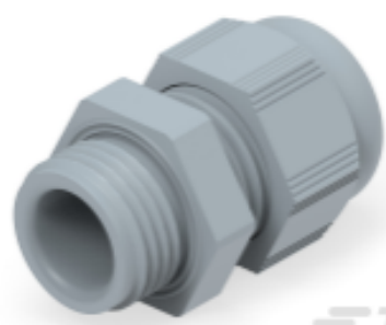
TE Teilnr.: 1SNG601188R0000 EP-SG-PG9-GR-A