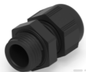
TE Teilnr.: 1SNG601192R0000 EP-SG-PG9-BL-B