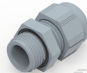
TE Teilnr.: 1SNG601191R0000 EP-SG-PG9-GR-B