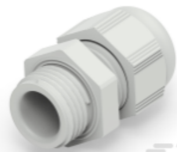
TE Teilnr.: 1SNG601190R0000 EP-SG-PG9-LGR-B