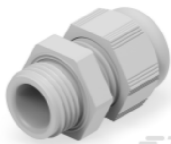
TE Teilnr.: 1SNG601187R0000 EP-SG-PG9-LGR-A