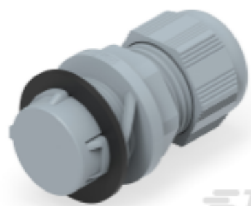
TE Teilnr.: 1SNG622020R0000 EP-SIG-SZ25-GR-A