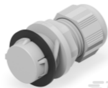
TE Teilnr.: 1SNG622022R0000 EP-SIG-SZ25-LGR-B