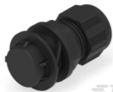
TE Teilnr.: 1SNG622021R0000 EP-SIG-SZ25-BL-A